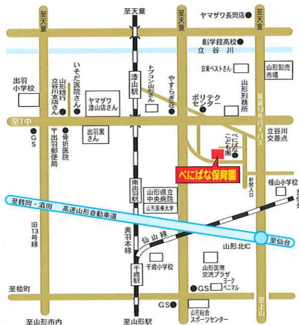
べにばな保育園案内図